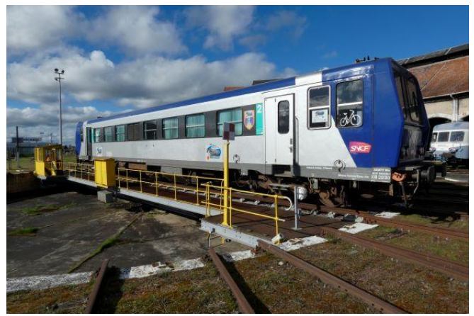
Remise en état des WC sur le X2230