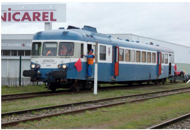
Début de visite quiquénales pour le X2900