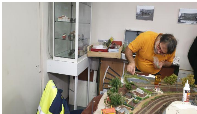
Opération décor sur les différents réseaux HO et HOe