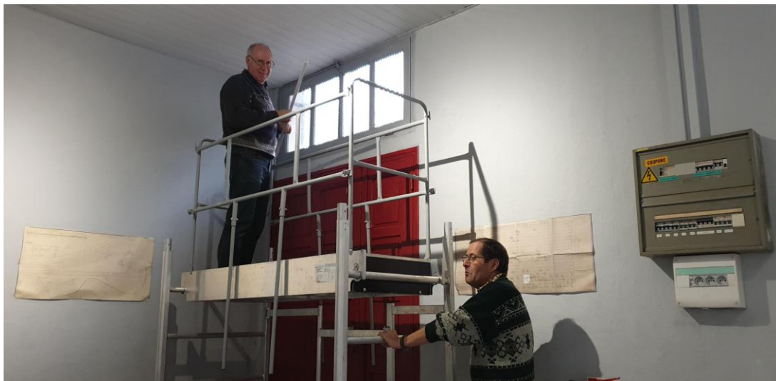
Poursuite des travaux de finition du second œuvre