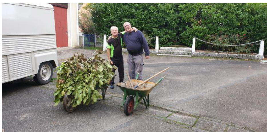
Fraternisation entre les “Noirs” et les “Verts”