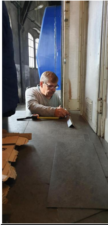
Pose du revêtement de sol sur plateforme d'entrée.