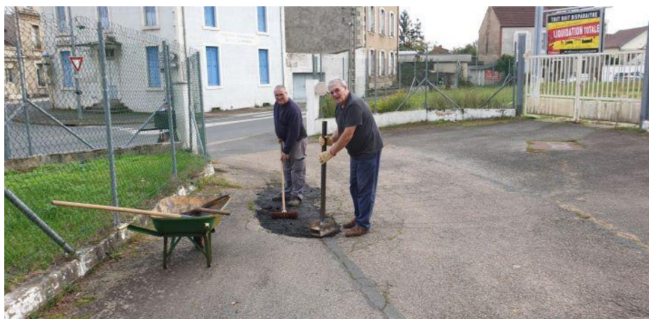
Les “Noirs” en pleine action de rebouchage des nids de poule.